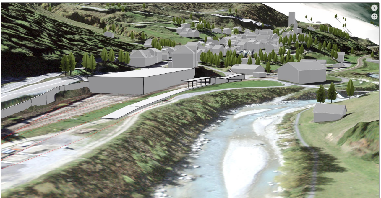
3D-Webszene mit der neuen Station Hospental und der Halle für die Instandhaltung des Rollmaterials und den Infrastrukturstützpunkt