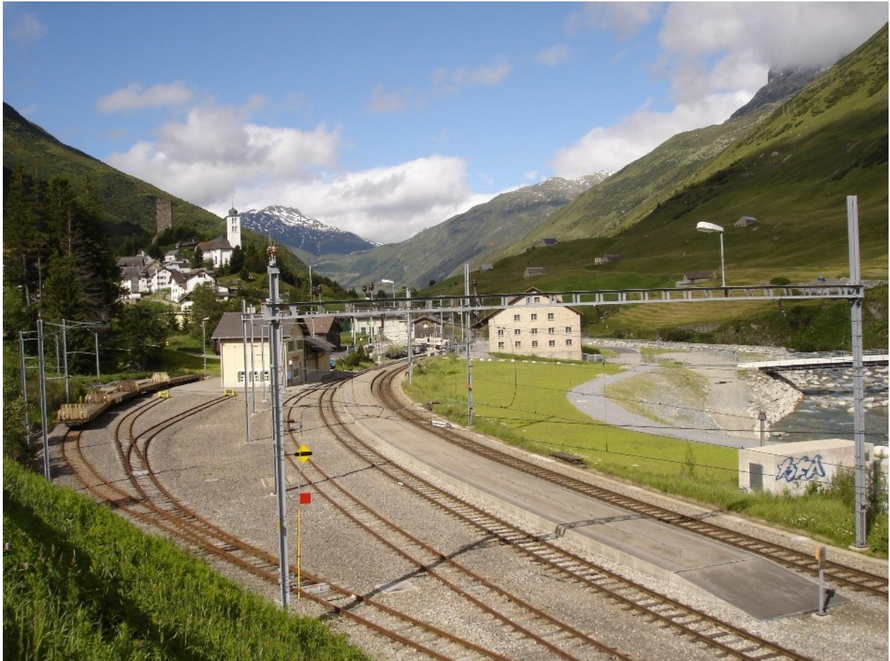
Die heutige Bahnstation Hospental mit dem Stationsgebäude (Bildmitte) und Blick auf das Dorf Hospental